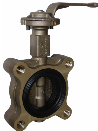
Sous réserve de modifications Photo non contractuelle