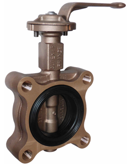
Sous réserve de modifications Photo non contractuelle