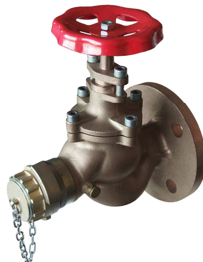
Sous réserve de modifications Photo non contractuelle

Dimensionnel hors standard nous consulter